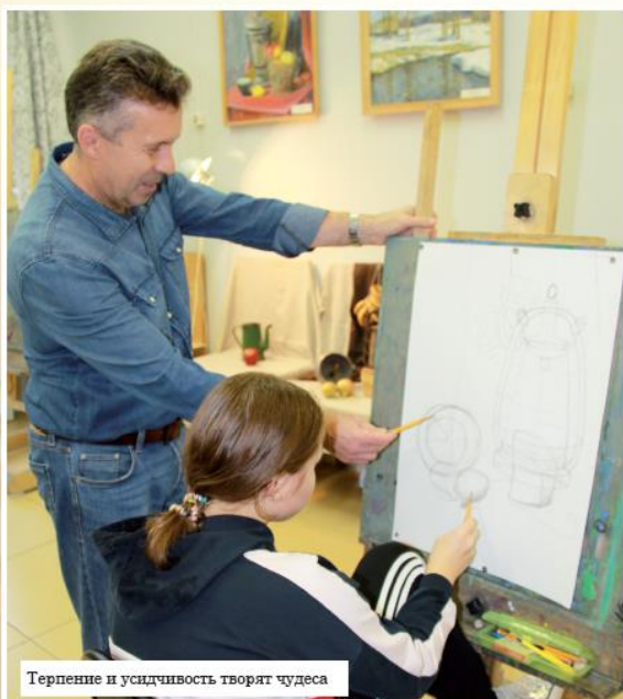
Терпение и усидчивость творят чудеса